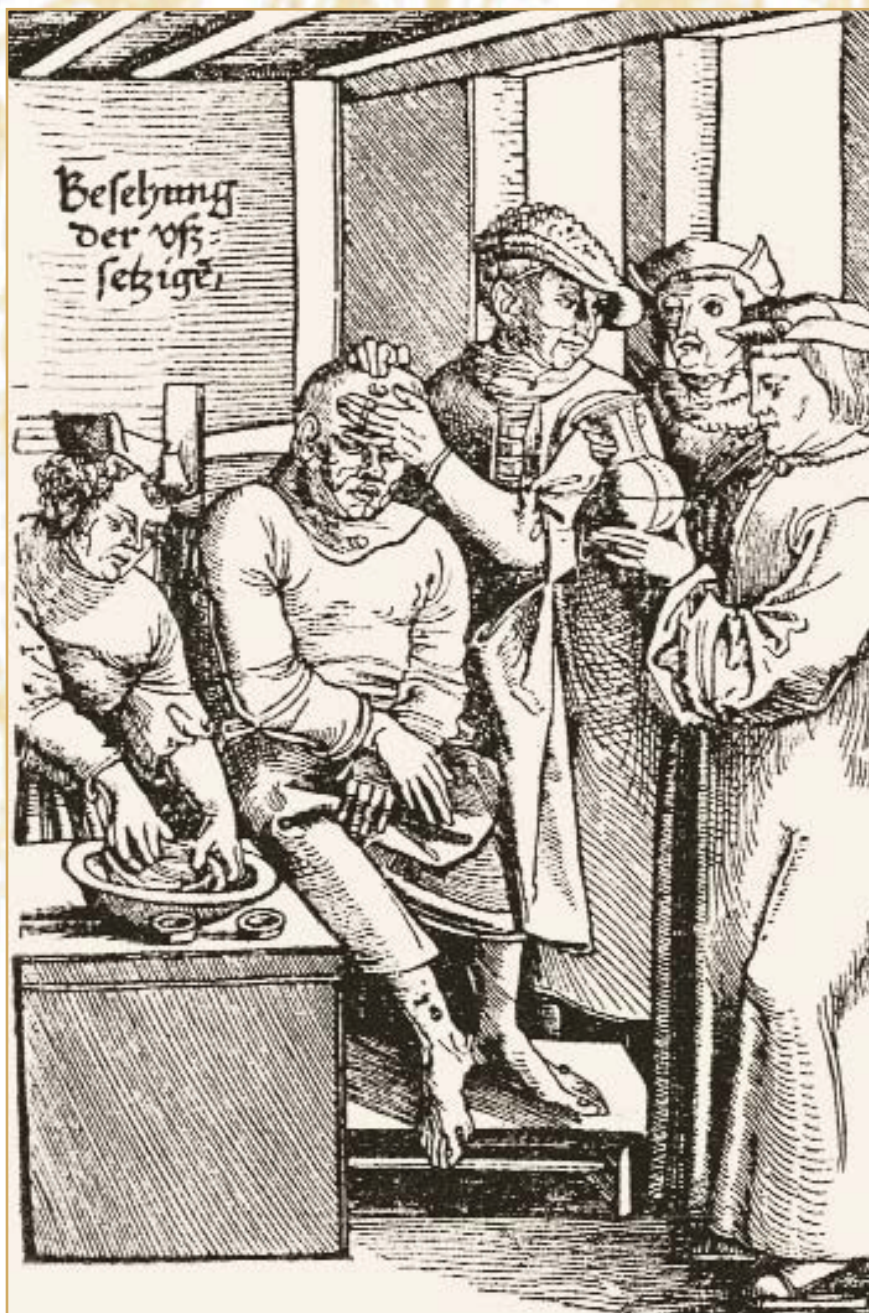
Консилиум. Гравюра. 1528 г.