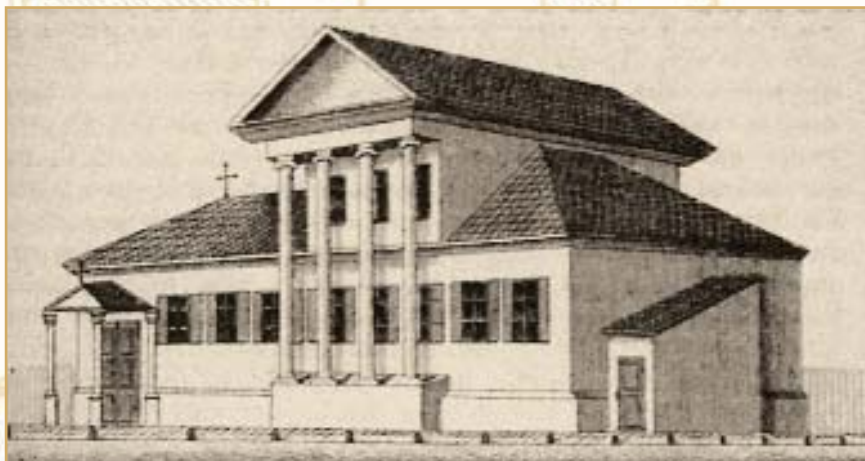
Лютеранская кирха на Подоле. 1812 г.

Между тем Георг-Фридрих Бунге, как и другие аптекари XVIII века, которым приходилось не только смешивать и продавать готовые лекарственные средства, но и производить их из первичных материалов, был разносторонне образованным и энергичным человеком. Умер знаменитый киевский аптекарь 19 августа 1792 года.