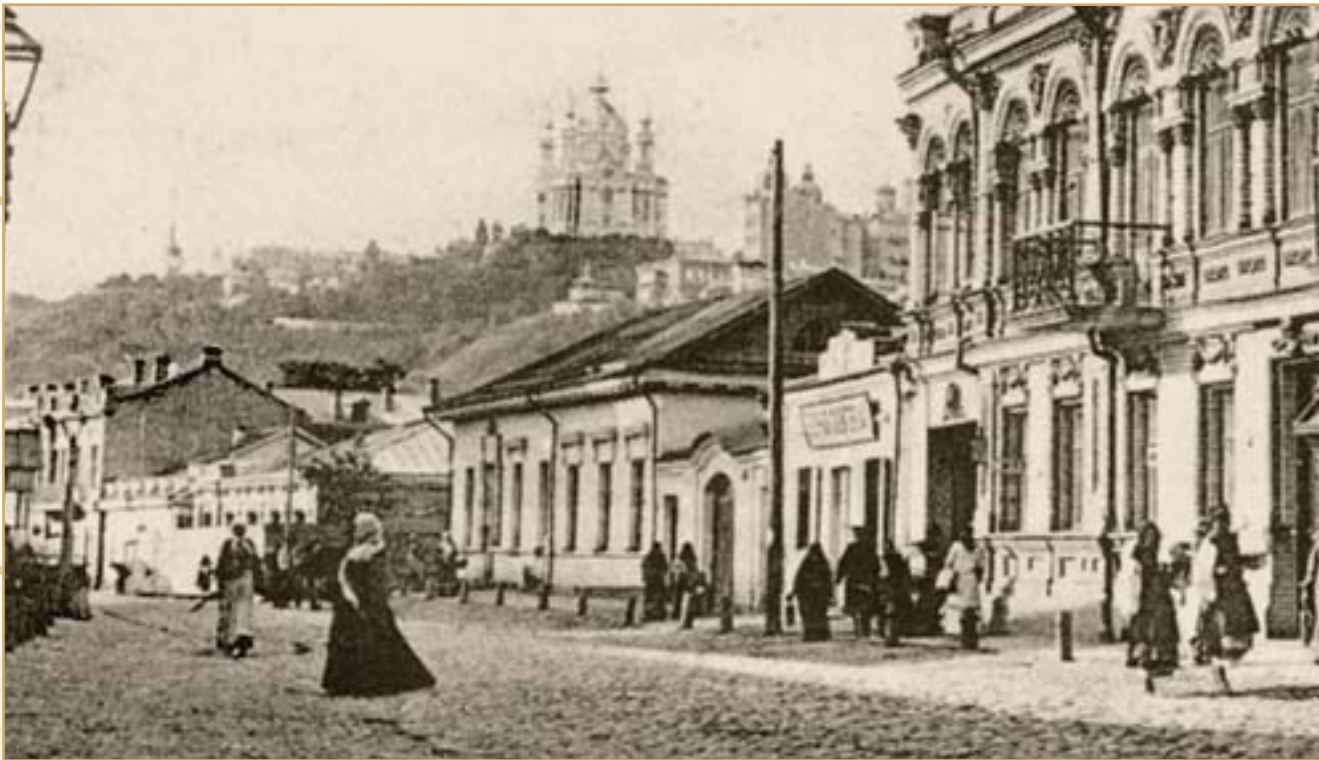
Дом аптеки Бунге (в центре) на Притиско-Никольской улице. 1900-е