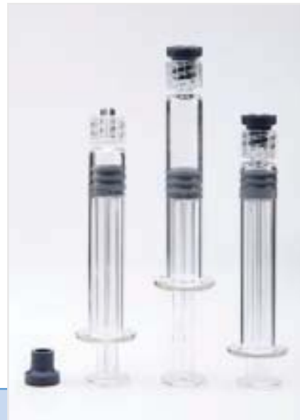
Шприцы с Luer lock адаптерами