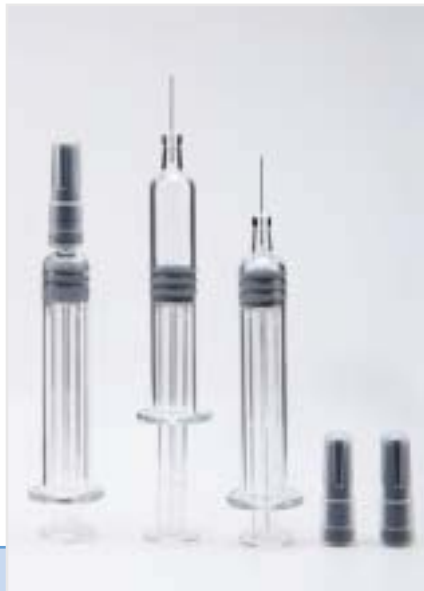
Шприцы с иглой

Покупатель может подобрать к этому типу шприца иглы любой конфигурации.