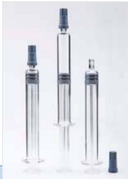
Шприцы с Luer наконечниками